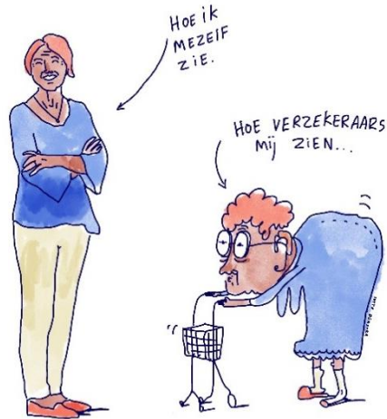
Illustratie: Lotte Dijkstra

levendige discussies, waaruit bleek dat er binnen de gemeentelijke organisatie bereidheid is om dit onderwerp verder te agenderen.